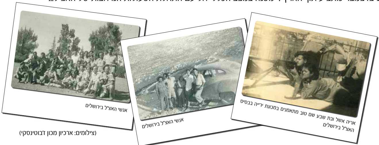
אנשי האצ"ל בירושלים

ב-14 בדצמבר כותב עיתון "הארץ": "מפנה במצב הכללי חל עם התחלת הפעולות הנרחבות של האצ"ל..."