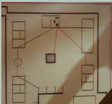
תרשים ניר עמל כפי שמופיע בתצוגה במוזיאון ה"הגנה"