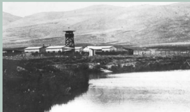
תל עמל בימים הראשונים לעלייה על הקרקע.